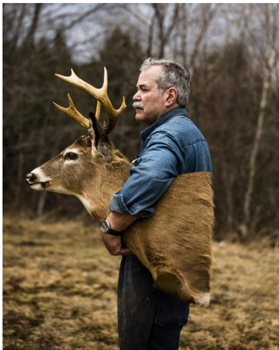
The Kingdom