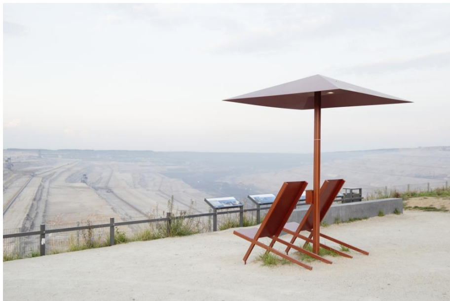
Léonie Pondevie, série Fossilis – Collectif Nouveau Document