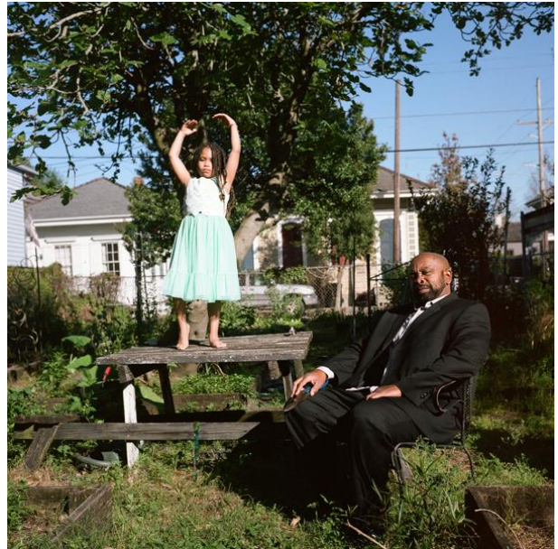
Un enfant chantera parfaitement sous un figuier