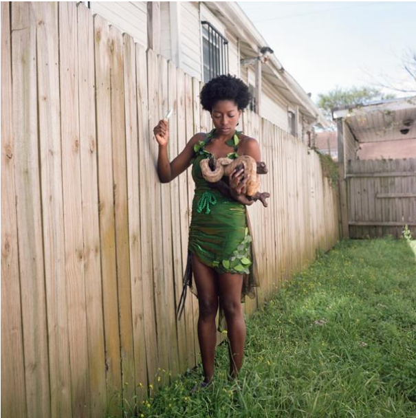
Si vous voulez qu'il pleuve, tuez un reptile