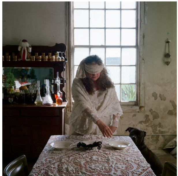
Pour deviner si un mariage sera heureux, disposez trois soucoupes, la première sera remplie de cheveux, la deuxième d'eau et la troisième laissée vide. Bandez les yeux d'une femme et guidez-la jusqu'aux soucoupes. Si elle touche celle aux cheveux le mariage sera heureux, si elle touche l'eau, il le sera également mais la mariée épousera un étranger. Si elle touche la soucoupe vide, le mariage n'aura pas lieu.