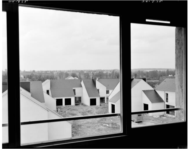
Chantier de construction à Acigné, mai 1978