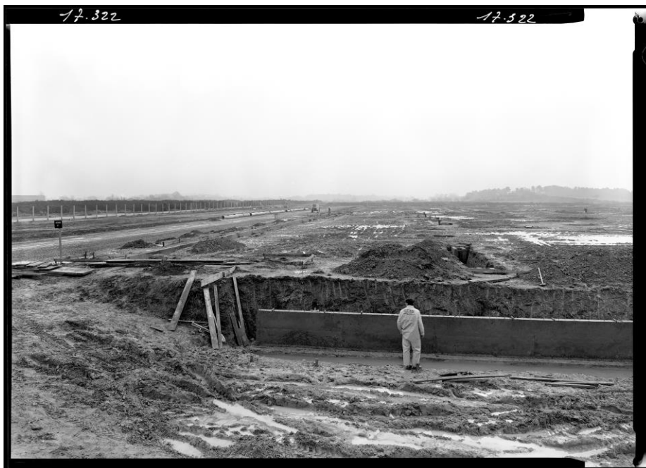
Chantier de construction, Lorient, décembre 1969