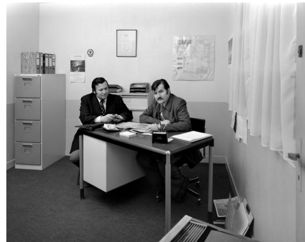
Bureau de direction d'une d'entreprise, février 1973