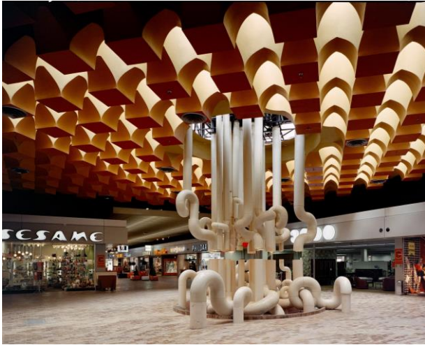
Inauguration du Centre commercial Alma, Rennes, 1971