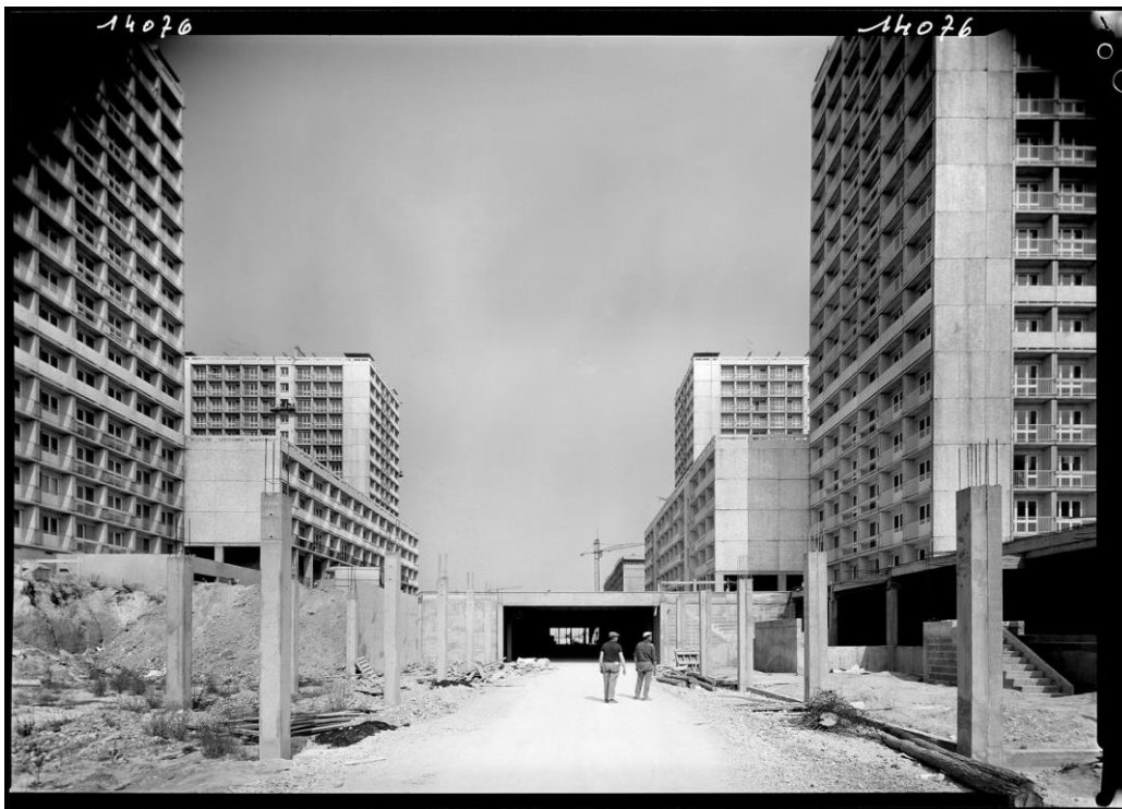
Construction du quartier de Villejean à Rennes, vers 1965